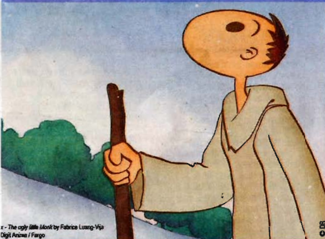
« The ugly little Monk by Fabrice Luang-Vija Digitl Anima / Fargo