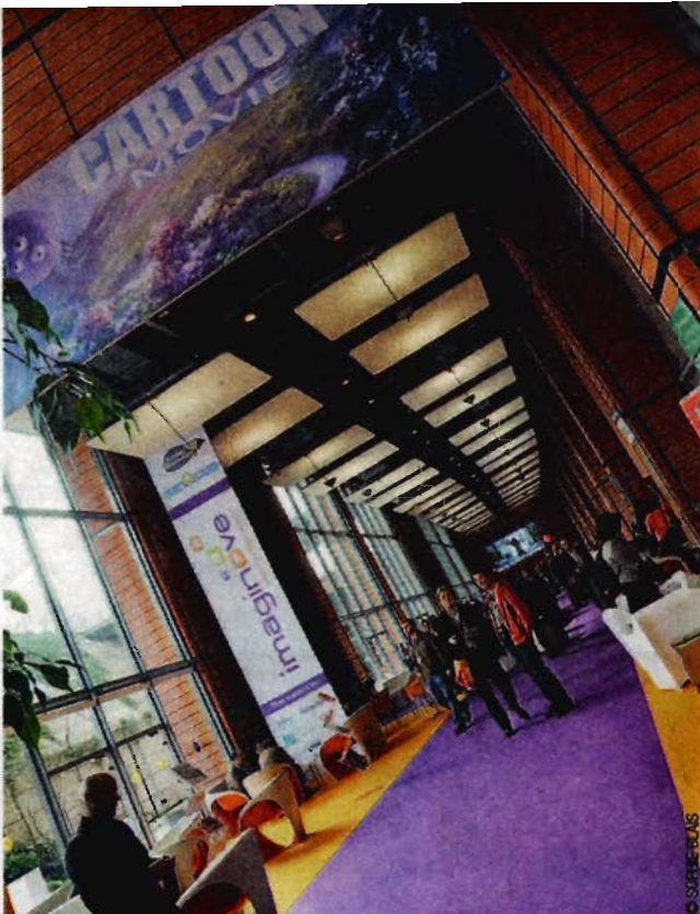
Le 11 e Cartoon Movie : 53 projets d'animation, dont 22 français.