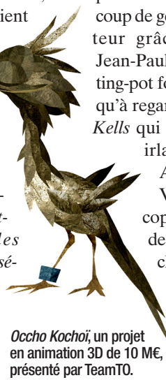
Occho Kochoi , un projet en animation 3D de 10 M€, présenté par TeamTO.

vraiment des marchés mais qui cherchent à favoriser le montage des coproductions, que ce soit dans le long métrage ou le documentaire. C'est précisément ce que fait Cartoon Movie depuis dix ans dans l'animation." ■